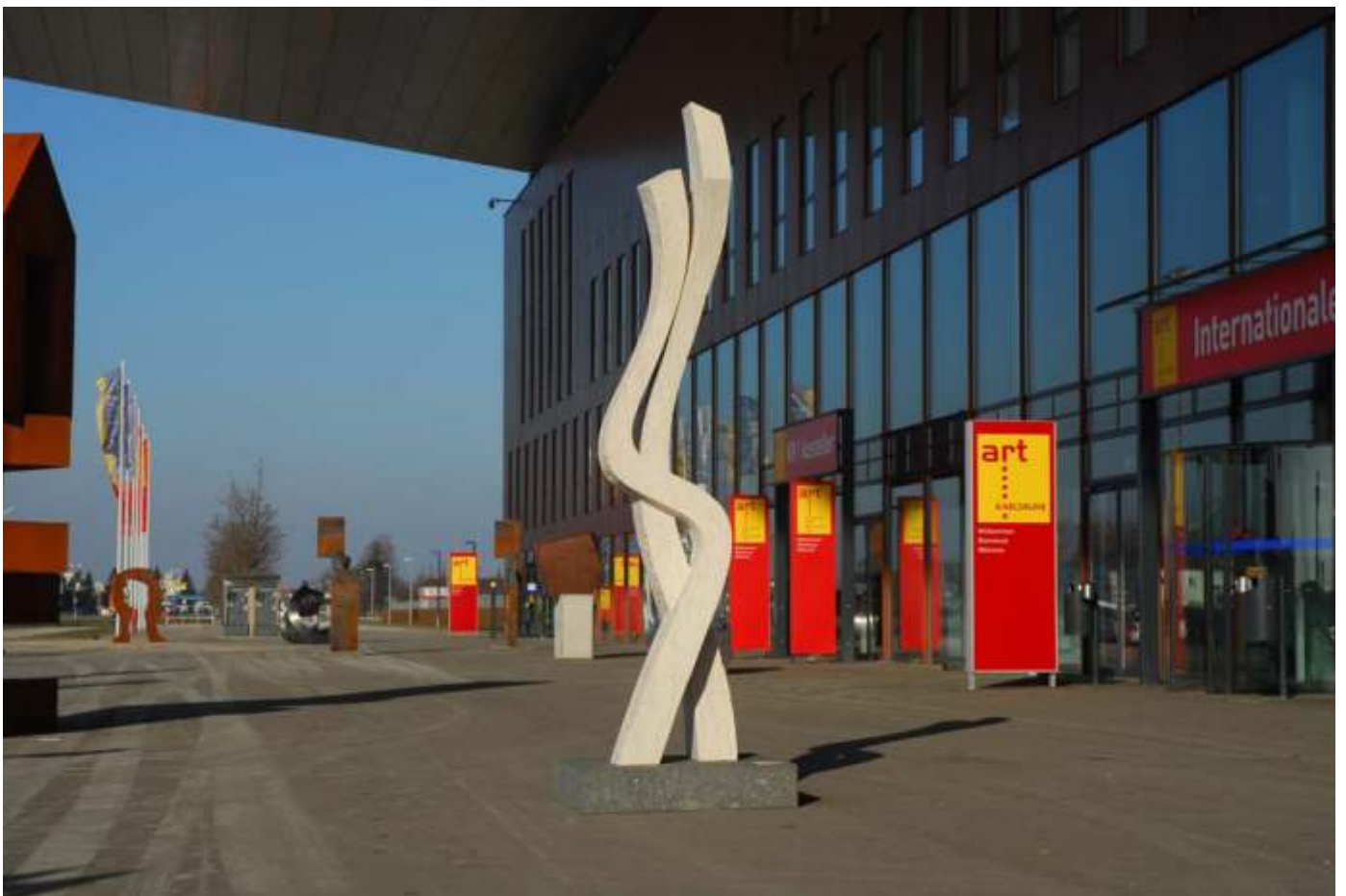
Titel: 1-12 Entstehungsjahr: 2012 Material: Kanfanar Kalkstein (Vorkommen Istrien, Kroatien) Höhe: 340cm Gewicht: ca. 1,5 to Sockelgröße: 103 x 103 cm