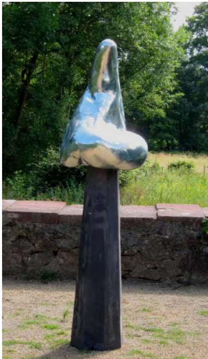
Drum bin ich keine Göttin, 2011 Zinkblech, Blindnieten, Holz, Spachtelmasse 180 x 60 x 60 cm