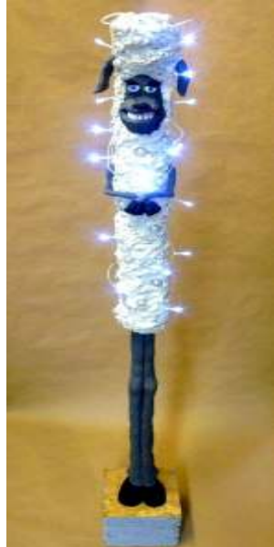
„Florence“ ( Schaaf) 2012 Beton, modelliert Circa 1,5 m