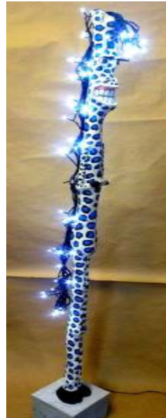
„Stuart“ 2012 Beton, modelliert Circa 2 m