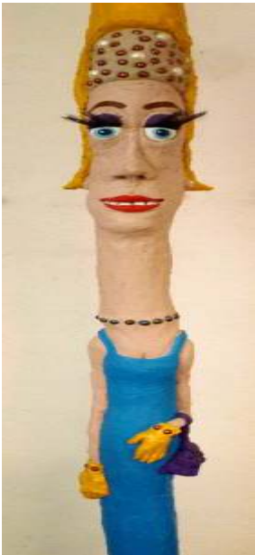
„Dorothy“ 2012 Beton, modelliert Circa 2 m