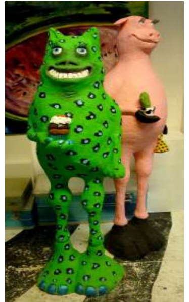
„Fred „ (grüner Monster) „Petunia“ (Schwein) 2011 Beton, modelliert Circa 1,6 m / 1,9 m