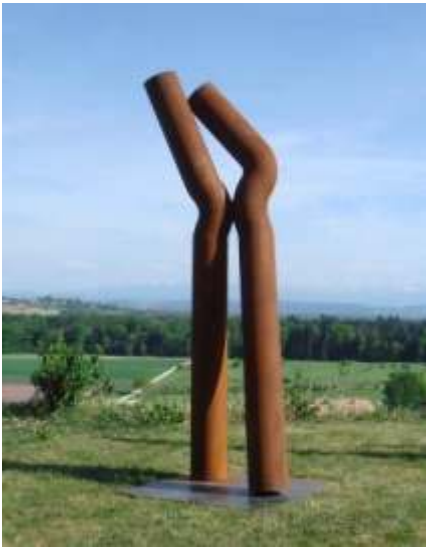
Chromosom 168-5 2007, Stahl, 200 x 80 x 80 cm