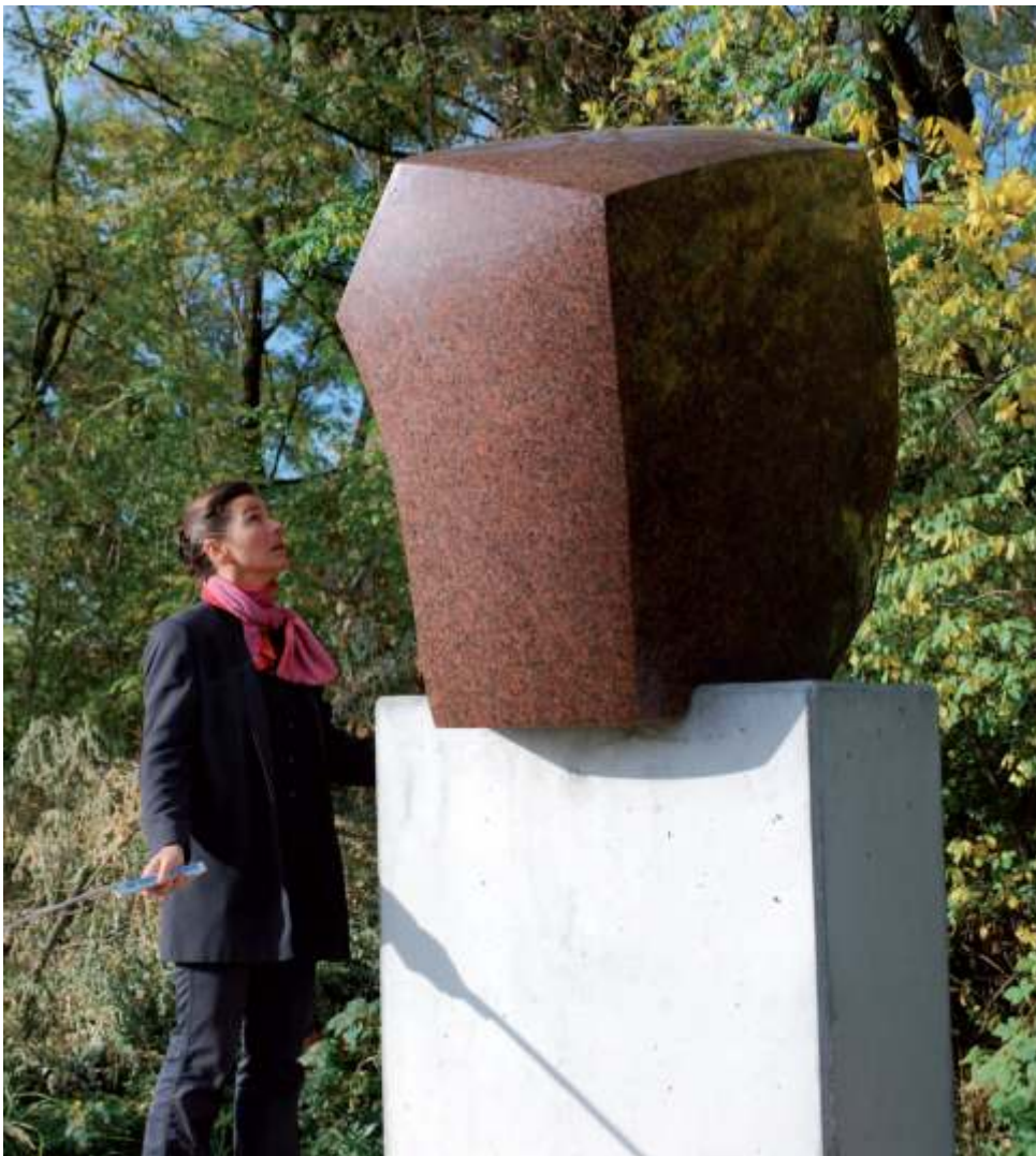
Big Head • 2012 • Schwedischer Granit auf Betonsockel • Granit, ca. 120 x 80 x 120 cm