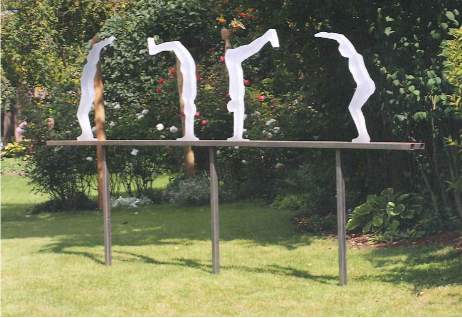
Die Welt steht Kopf ! Steht die Welt Kopf ? 6000 x 1850 x 200 mm, Stahl, in Form geschmolzenes Bleikristall, gesandstrahlt