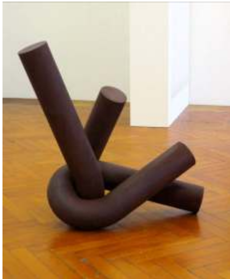
Chromosom 168-L-3 2012, Stahl, 108 x 95 x 70 cm