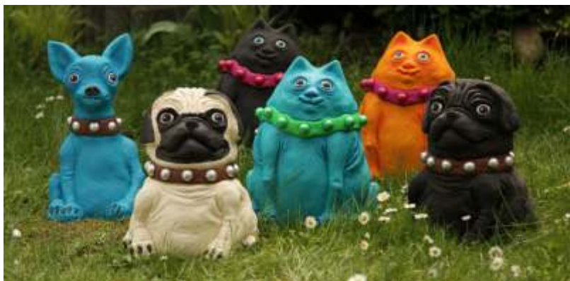
„Penelope“ (Chiwawa) - „Wayne“ (Mops, hell) - „Bruce“ (Mops, dunkel) „Tommy-Lee“ (Katze, blau) - „Mary-Loo“ (Katze, orange) - „Medo“ (Katze, schwarz) 2013 Beton Gegossen Circa 30 cm