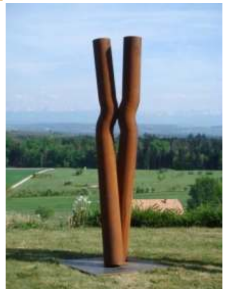
Chromosom 168-4 2007, Stahl, 210 x 80 x 80 cm