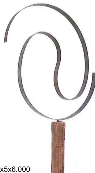
Eternidad Bandstahl, 80x5x6.000