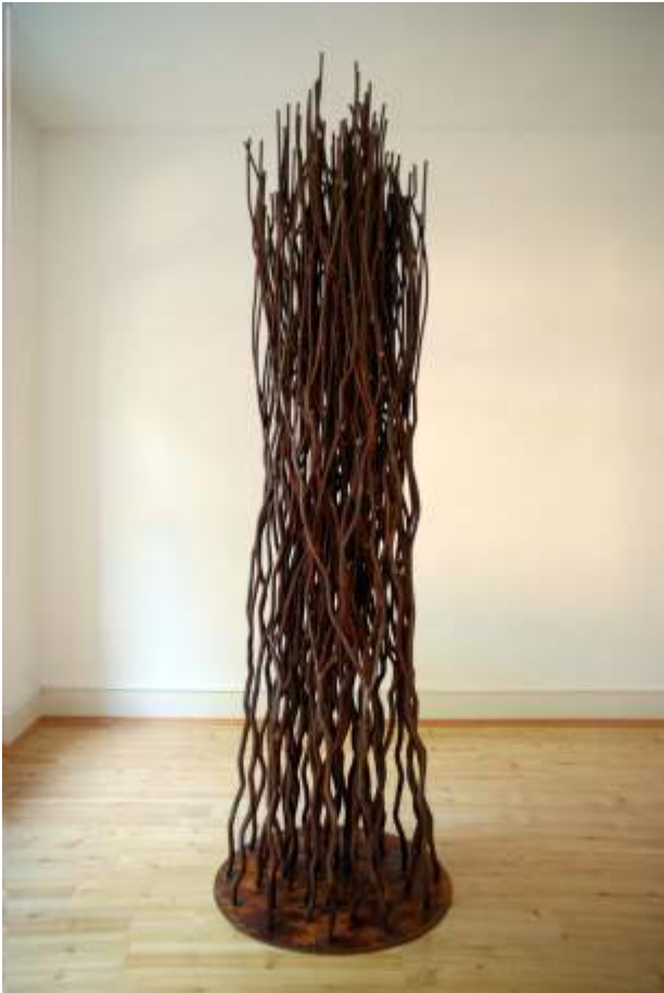
Waldstück LII (52), 2012 Stahl, 286 x 82 x 82 cm, 340 kg