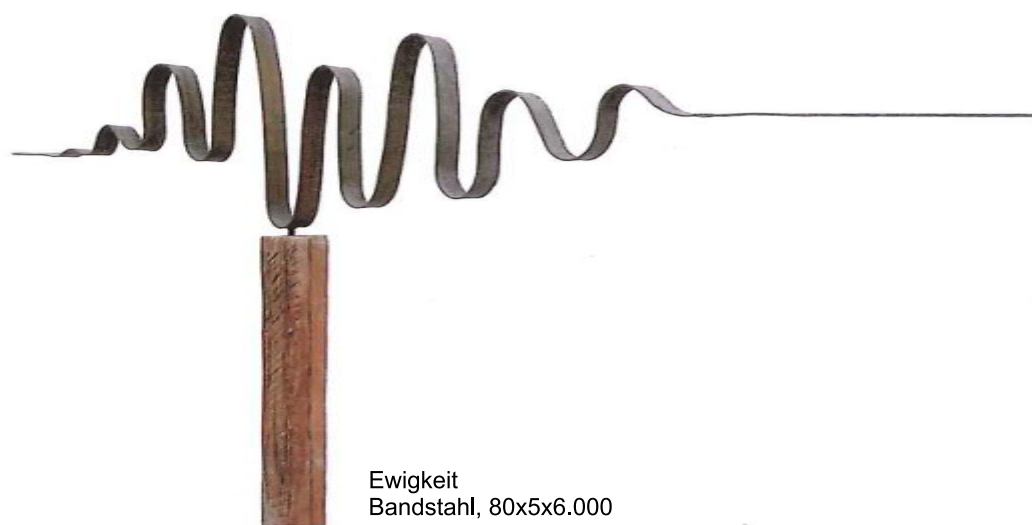
Ewigkeit Bandstahl, 80x5x6.000