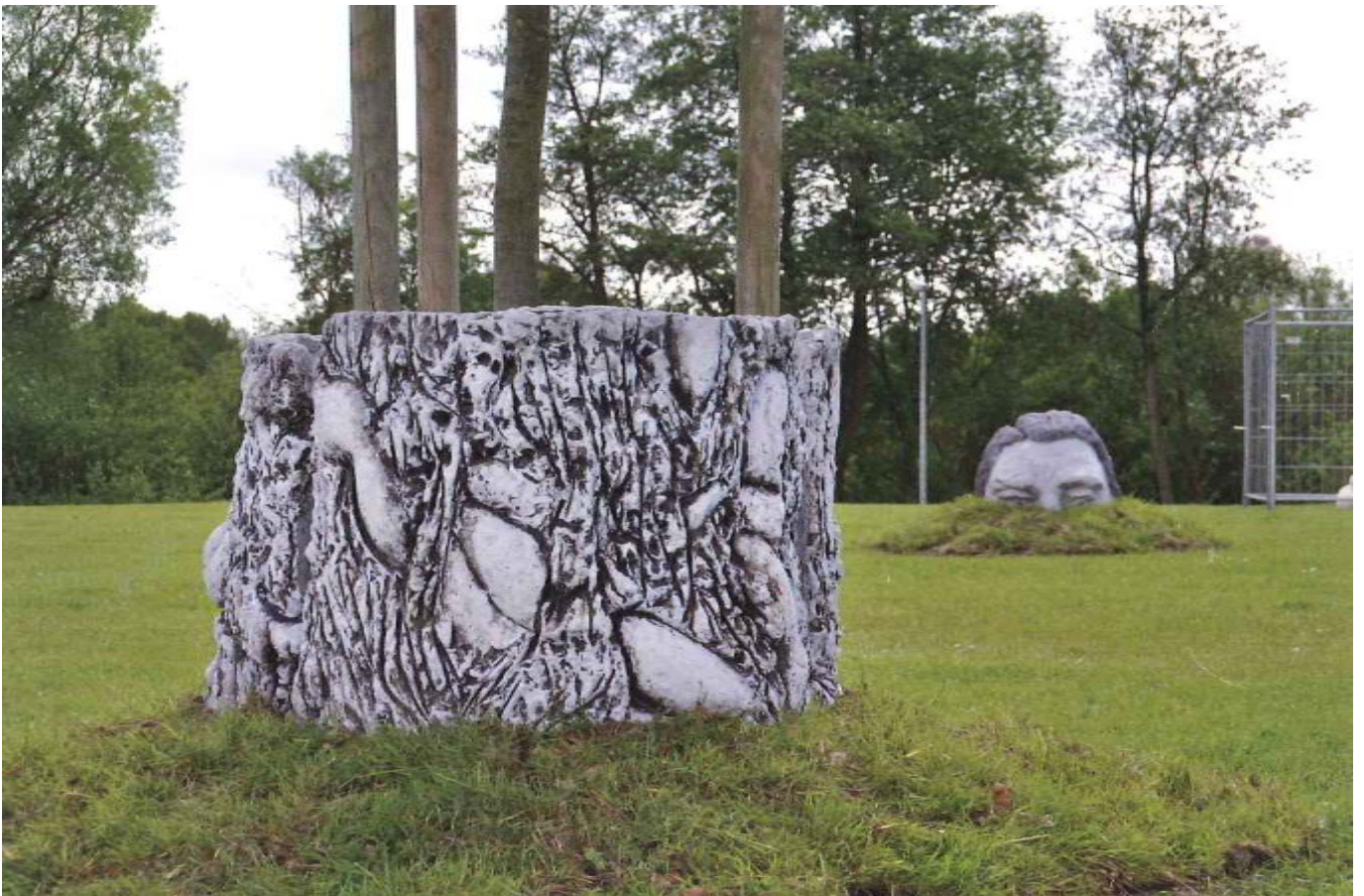
Baum, Beton, Bebauungspläne, 2009 Installation, 700 x 400 x 1100 cm