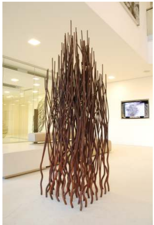
Waldstück XLIX (49), 2012 Stahl, 230 x 65 x 65 cm, ca. 300 kg